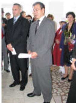
E.S. Dl. Ambassador