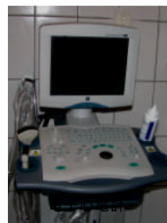
Aparat pentru analize cu ultra-sunete