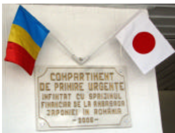
Placa memoriala instalata in spital

Echipamente: Sistem automat pentru electroforeza(2), Aparat pentru analize cu ultra-sunete(2), Aparat pentru electroforeza(1), Analizator biochimic(1), Ambulanta(1).