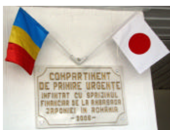
病院内に設置された記念プレート